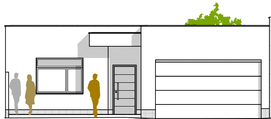
FACHADA CALLE VIDAL MARÍN DEL CAMPO