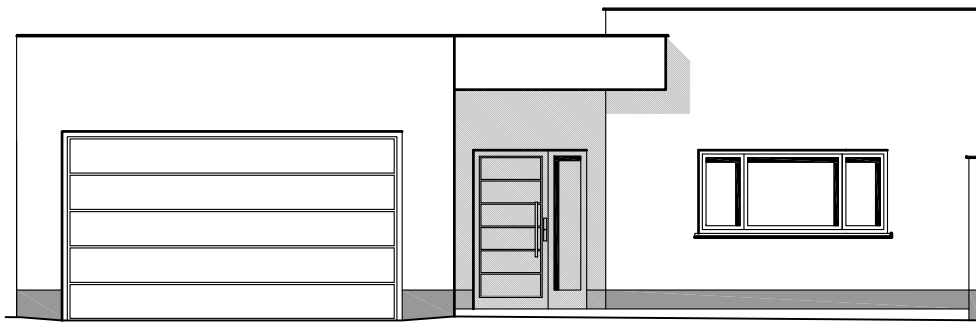
FACHADA A CALLE ALFEREZ DE LA VIRGEN